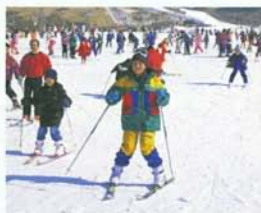
ウインタースポーツ▶