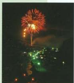
▲花火・ザ・宝泉寺

鳴子川渓谷の雄大な景色を満喫したら 九重の豊かな恵みも楽しもう！ 豊かな自然と温泉、季節の風景と楽しいイベント、 おいしい食事。チェックして！